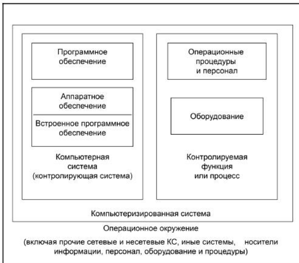
Рисунок 1 - Схема взаимодействия различных компонентов КС в ее операционном окружении

4.1.1 КС состоит из компьютерной системы и контролируемой функции или процесса. Компьютерная система представляет собой всю совокупность аппаратного и программного обеспечения (контролирующего аппаратное обеспечение), а также встроенного ПО и установленных устройств. Контролируемая функция может представлять собой оборудование (например, автоматизированное производственное оборудование, лабораторные или технологические контрольно-измерительные приборы), которым необходимо управлять, и алгоритмы действий, определяющих его работу. В качестве контролируемой функции также может выступать операция, для выполнения которой не требуется другого оборудования, за исключением аппаратного обеспечения компьютера. Интерфейсы и сетевые функции [через локальную вычислительную сеть (ЛВС, LAN) и глобальную вычислительную сеть (ГВС, WAN)] также являются особенностями КС и операционного окружения, потенциально связывающими воедино множество компьютеров и приложений (см. рисунок 1). Информационно-технологическая инфраструктура организации, функциональность и взаимодействие с прочими системами должны быть четко определены и подлежат контролю в соответствии с действующими правилами надлежащей производственной практики ( приложение 11 ) [1].